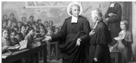
Saint Jean-Baptiste de la Salle

Il y a 300 ans, s'éteignait son fondateur Saint Jean-Baptiste de La Salle. Retour sur une aventure extraordinaire.