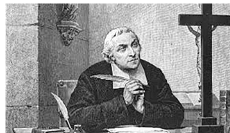
Saint Jean-Baptiste de la Salle

Les Frères sont également présents dans les formations liées à la spiritualité et la pédagogie selon les intuitions de Jean Baptiste de La Salle (formation du CLF Centre Lasallien Français et du CORELA Comité pour la Recherche Lasallienne). Plusieurs milliers de laïcs ont suivi les cours du CLF depuis 1986. Saint Jean-Baptiste de la Salle